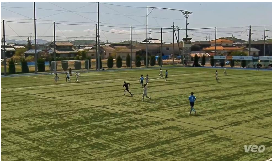
現場と映像とで飛び出しの差がありました