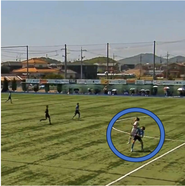
選手の意図はどうだったか